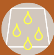
SCHMUTZ- UND WASSERABWEISEND