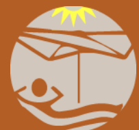
UV- UND SONNENSCHUTZ